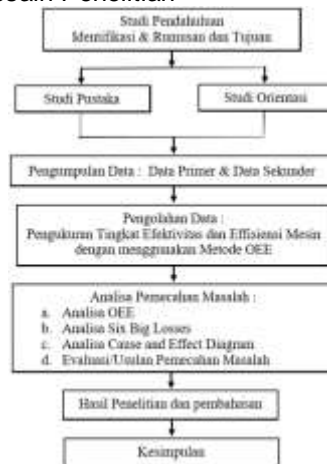
Gambar 1. Design Penelitian (Sumber: Data Penelitian, 2020-2021)