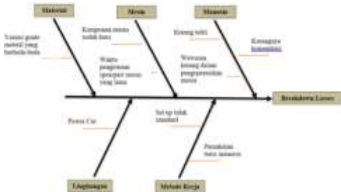
Gambar 3. Diagram Fishbone – Breakdown Losses

Dalam diagram fishbone akan diketahui penyebab tingginya faktor rework Losses dan breakdown loss .