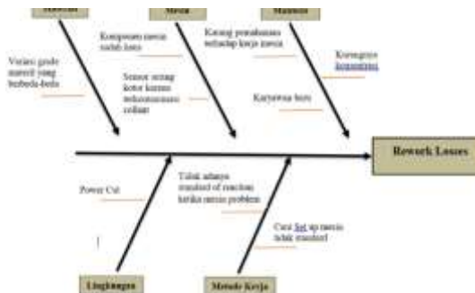
Gambar 4. Diagram Fishbone – Rework Losses

Dalam diagram fishbone akan diketahui penyebab tingginya faktor rework Losses dan breakdown loss .