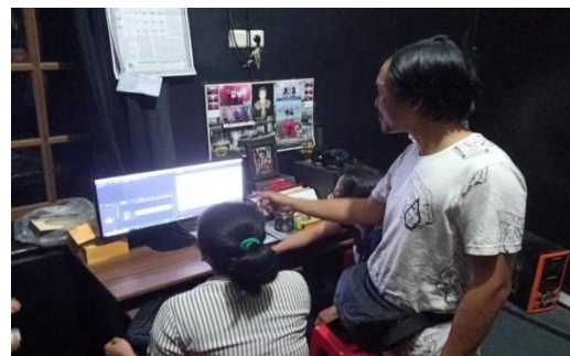
Gambar 1. Kegiatan Pelatihan Editing Video Mahasiswa STMIK STIKOM Indonesia

yang berbeda dengan urutan yang bebas. Berikutnya adalah langkah sinkronisasi suara. Jika hanya salah satu dari tiga kamera tadi yang dijadikan sebagai sumber suara utama tentu, saja bisa dipastikan video dari 2 kamera lainnya akan mengalami miss lipsync , artinya gerak mulut presenter tidak sesuai dengan suara yang terdengar. Untuk itulah proses sinkronisasi 3 videodengan satu suara tadi perlu dilakukan. Selanjutnya dari hasil pendenifisian marker maka langkah berikutnya adalah mensinkronisasikan 3 channel video tersebut. Cukup men- drag video yang dimaksud dan sejajarkan semua tanda marker dalam satu garis timeline yang sama. Karena sistem snap diaktifkan secara default oleh software premiere , maka secara otomatis masing - masing tanda marker akan merespon satu sama lain menjadi sejajar secara garis vertikal ketika mereka saling bedekatan, sehingga proses sinkronisasi tidak akan meleset.