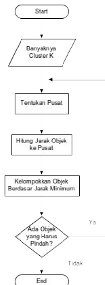
Gambar 2. Diagram Alir K-Means

Berikut adalah diagram alir dari proses algoritma K-means :