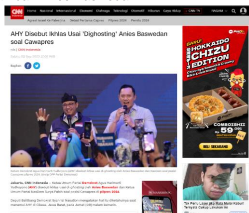
Gambar 2. Berita cnnindonesia.com